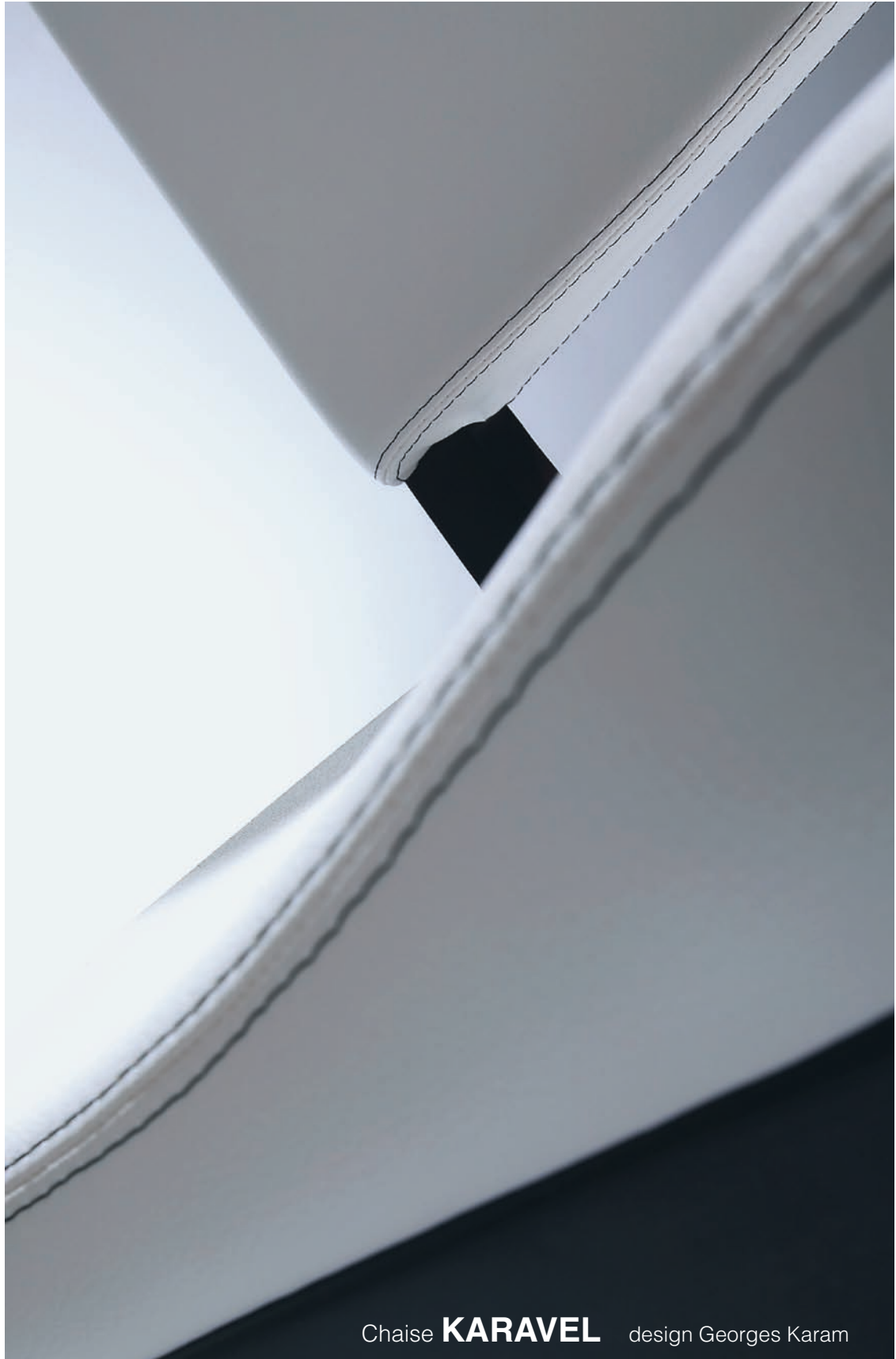
Chaise KARAVEL design Georges Karam